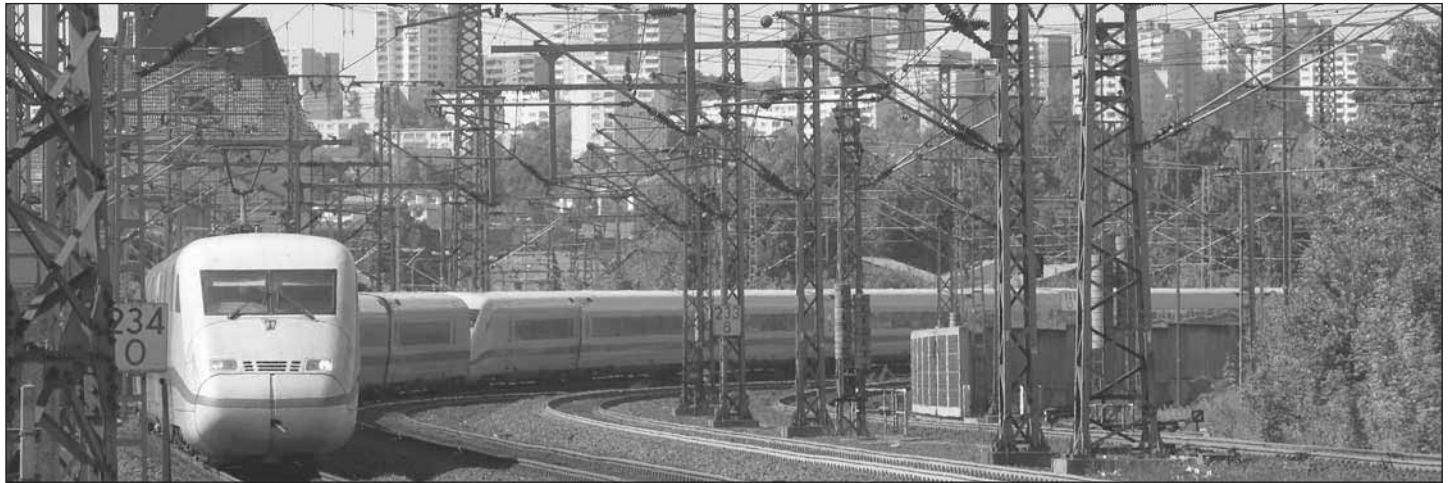
ICE in Fulda

Wenn Reisende auf den Bahnhöfen der Republik auf verspätete Ersatz-ICEs warten, wenn Weichenstörungen oder Oberleitungsschäden die Zugfahrt zum Abenteuer mit ungewissem Ausgang machen, wenn wir im ausgedünnten S-Bahn-Verkehr in der Hauptstadt auf der Strecke bleiben – dann ist es nicht das Wetter, das unser Recht auf Mobilität vermasselt, sondern die Frostperiode des Neoliberalismus. Das Desaster der Bahn ist das Ergebnis einer Politik, die die Bahn auf Börsenkurs bringt: nicht am Allgemeinwohl orientiert, sondern als kapitalistischer Konzern aufgestellt, im Interesse potenzieller Investoren.